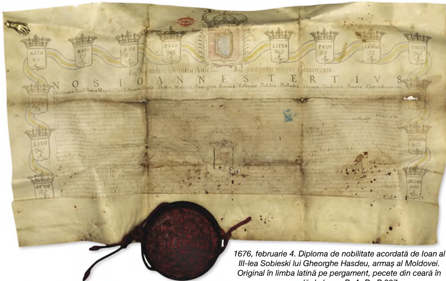
1676, februarie 4. Diploma de nobilitate acordată de Ioan al III-lea Sobieski lui Gheorghe Hasdeu, armaș al Moldovei. Original în limba latină pe pergament, pecete din ceară în capsulă de lemn. B. A. R., P 327

avea o imagine a puterii pe care această familie o deținea în secolul al XIX-lea, amintim că terenurile în proprietate din București se întindeau de la Piața Chirigiu până la Șoseaua Viilor, precum și pe Podul Mogoșoaiei sau pe strada