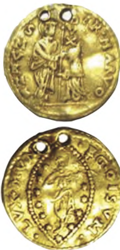
Jumătate de ducat venețian de la Francesco Morosini (1688-1694)