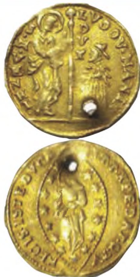
Ducat venețian de la Ludovico Manin (1789-1797)