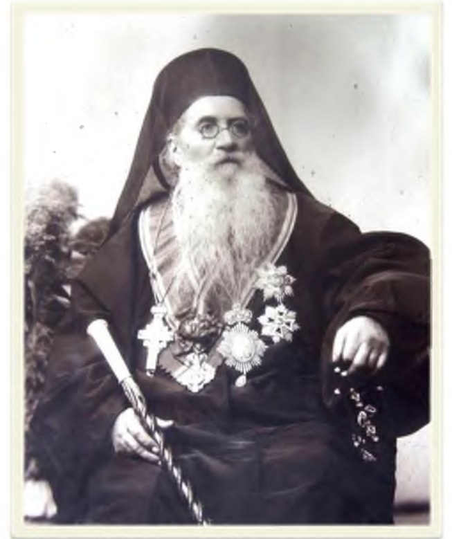
Mitropolitul Iosif Naniescu

cele mai multe cărți vechi, 143 volume de manuscrise și un mare număr de documente originale din cele două principate, din Transilvania și din Ungaria. O altă bibliotecă, adusă aproape în întregime la Academie, a fost aceea a cunoscutului învățat francez A. Ubicini, care a lăsat prin testament biblioteca sa statului român care, la rândul său, a dăruit-o Academiei. Ea cuprindea 1 049 volume de cărți tipărite și un număr de manuscrise. De asemenea, la 6 martie 1882 a fost anunțată în Adunarea generală a Academiei Române donația bibliotecii lui Nifon Bălășescu, care va fi primită la Academie în 1887 și