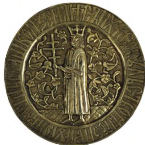
Bula de aur de la Petru Cercel