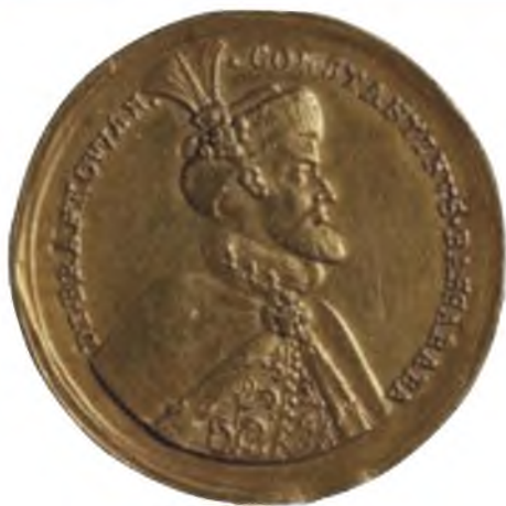
Medalia de aur a lui Constantin Brâncoveanu