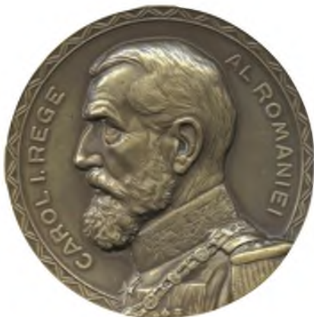
Medalia din argint a clădirii Ministerului Lucrărilor Publice

La numai câțiva ani de la Unirea Principatelor din ianuarie 1859, arhitectura instituțională a României era completată în 1866, prin fondarea, după modelul statelor apusene și slujind interesului național, a Societății Literare Române, devenită în 1867 Societatea Academică Română, proiecte în această privință existând și în deceniul precedent, unul aparținându-i chiar lui D. A. Sturdza. Structura Societății Academice se întemeia pe trei secții: filologie, istorie, arheologie și științe naturale. Un an mai târziu și integrată acestea avea să se constituie Biblioteca Academiei Române, instituție cu profil enciclopedic și universal, menită a susține documentar activitatea secțiilor, dar și a recupera și păstra cât mai multe documente de istorie națională și universală specifice celor trei secții. Această organizare, eminentă științifică, nu ar fi trebuit să genereze nicio stare conflictuală cu alte instituții. Nu s-a întâmplat însă așa. În mod firesc, preocupările Bibliotecii Academiei