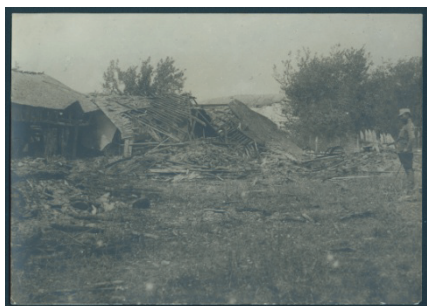
Mărăști, Case arse de inamic în retragere, 12 iulie 1917