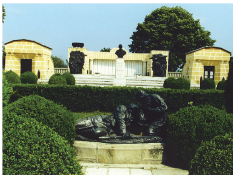
Mausoleul de la Mărăști, Direcția Județeană pentru Cultură și Patrimoniul Național Vrancea, http://www.vrancea.djc.ro/ObiectiveDetalii.aspx?ID=271

gurarea monumentelor s-a făcut în 2013 prin Regio – Programul Operațional Regional 2007-2013, gestionat de Ministerul Dezvoltării Regionale și Administrației Publice 87 .