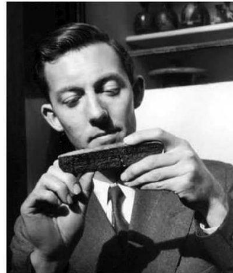
Michael Ventris (1922-1956)